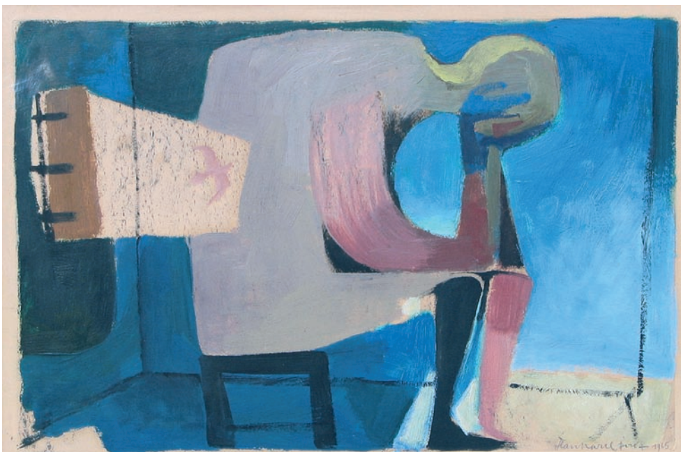
Tableau offert par Arcabas au père Buisson, évoquant la nuit obscure.

Marie de Béthanie se souvient de cela quand elle vient oindre les pieds de Jésus avec du nard de grand prix: «toute la maison se remplit de l'odeur du parfum». Puisse notre vie être aussi un parfum qui se répand.